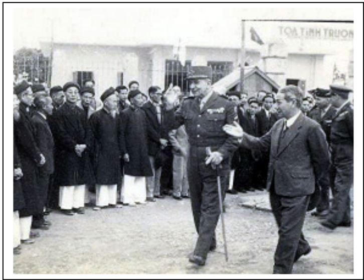
Visite du Gal De Lattre de Tassigny à SonTay.