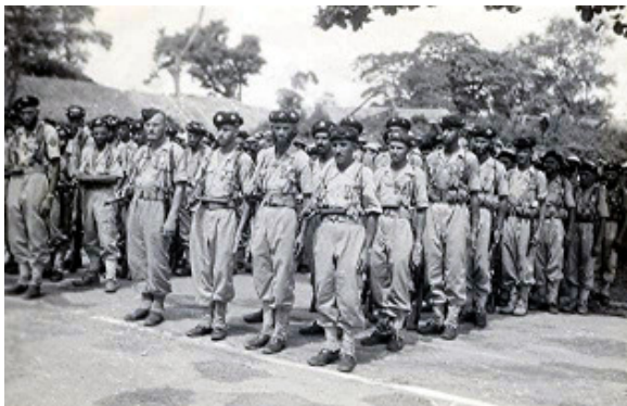
8° TABOR Tonkin