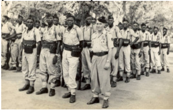
24° RMTS à SonTay