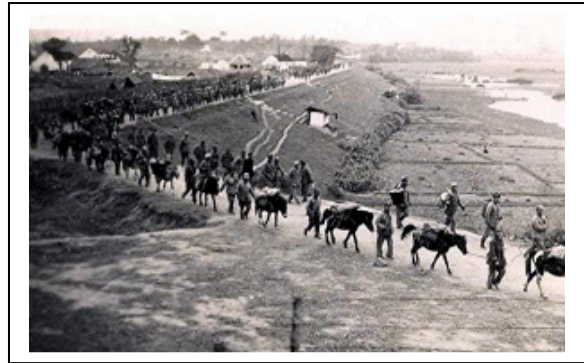
Troupes Nationalistes Chinoises...