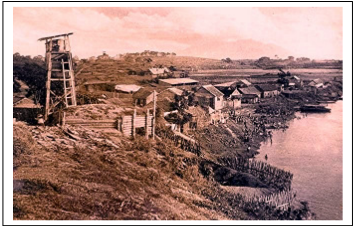
Poste de gué sur la Rivière Noire