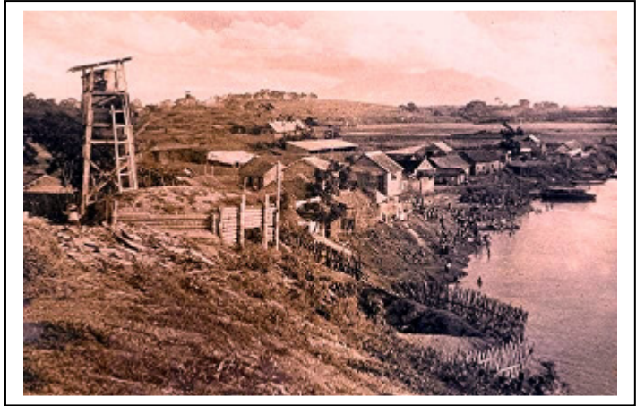
Poste de gué sur la Rivière Noire